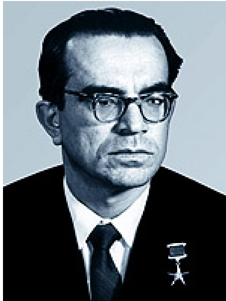
Академик АН СССР и АН УССР Виктор Михайлович Глушков (1923— 1982)

В СССР основы программной инженерии (технологии программирования) были заложены академиком В. М. Глушковым в Институте кибернетики НАН УССР.