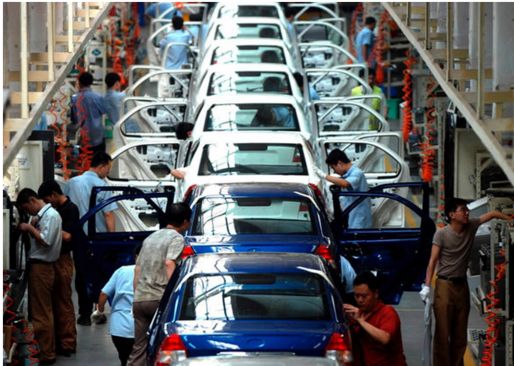
Современный конвейер для сборки автомобилей.